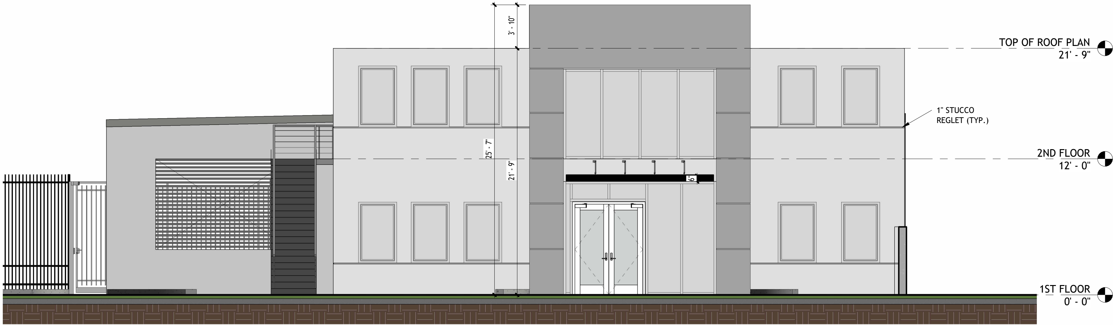
① WEST ELEVATION 3/16" = 1'-0"