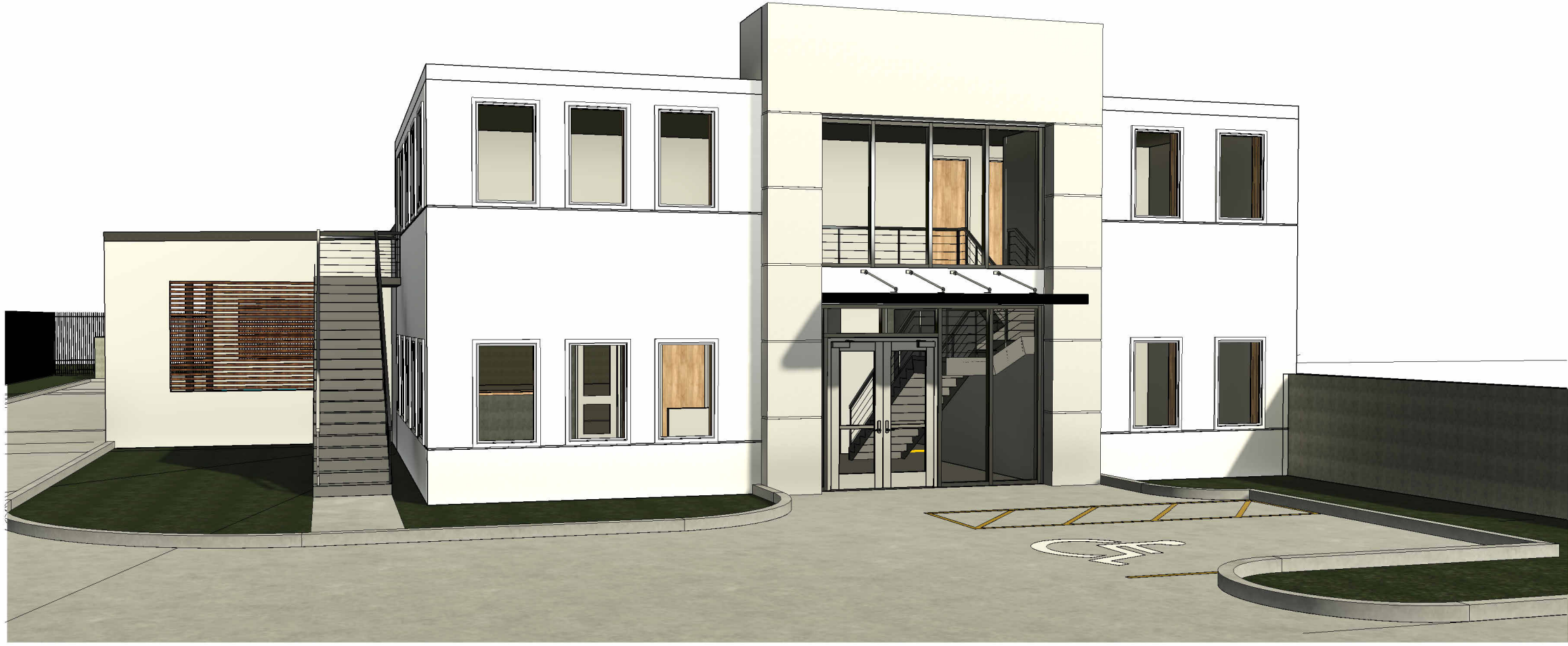
③ 3D View 1